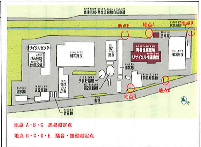
悪臭・騒音・振動敷地境界線上の測定箇所