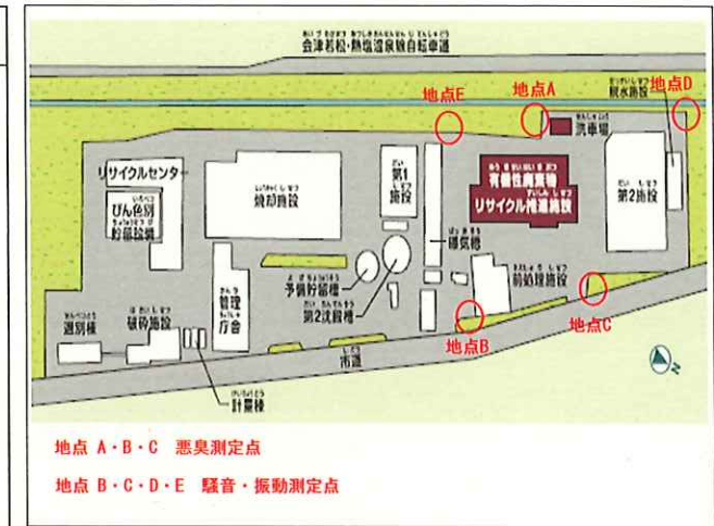
悪臭・騒音・振動数地境界線上の測定箇所